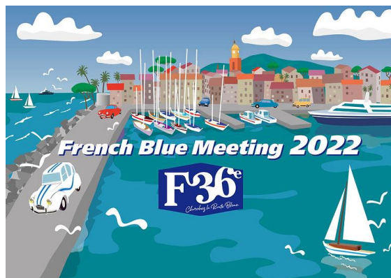
FBM de la mer ～海のフランス文化際～